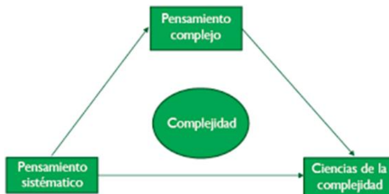
Figura 1. Posturas del pensamiento complejo

¿Cómo explicar comportamientos y estructuras tan complejas desde un enfoque reduccionista de diversas ciencias del comportamiento hoy en día? ¿Cómo explicar la complejidad con base únicamente en la interacción nerviosa en un cerebro tan pequeño como la de una abeja o con los rastros de feromonas en una colonia de hormigas? Una abeja por sí sola busca polen o pone huevos, pero cuando se asocia a cientos de individuos con funciones diferentes, forman un todo con propiedades emergentes, igual la hormiga o la termita. La complejidad es un fenómeno individual o grupal abordada desde distintas posturas (ver figura 1). Rocca & Anjum (2020) afirman que “un todo complejo puede consistir en partes que interactúan una con otra en una forma que influencia y altera las partes en sí mismas en el proceso” (p. 81).